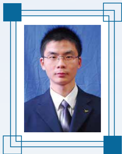
第一讲 不普通的普通话 (3月1日,星期一)

本讲内容: 通过本讲的学习,你将了解世界范围内汉语语言的使用现状,也将认识到汉语语言与英语等语言不同的性质特点以及汉语与中国人、中国文化的关系。此外,你还可以在学习中掌握一些简单的汉语日常生活用语和句子。