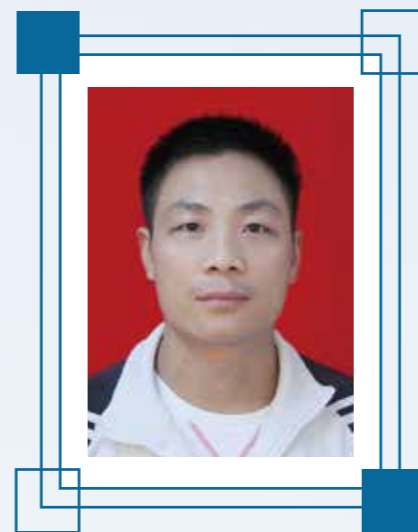
第十一讲 强身健体武术魂 (3月11日,星期四)