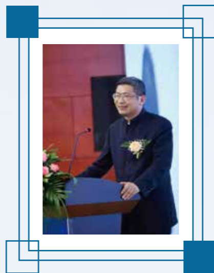
第十讲 书剑飘逸话兵圣 (3月10日,星期三)