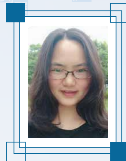
第十二讲 吉祥如意中国结 (3月12日,星期五)