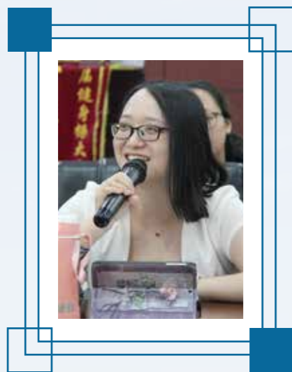
第九讲 活色生香的瓷艺 (3月9日,星期二)

本讲内容: 通过本讲的学习,你将了解到中西方瓷器的区别和联系、中国瓷器的发展历史、制作过程,以及对一些特殊瓷器作品(如青花釉里红、秘色瓷)进行赏析。此外,你还可以了解世界瓷器之都——景德镇独特的“景漂”文化,感受当地的艺术氛围。